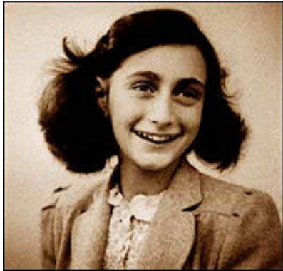
Anne Frank, photographiée en 1942

Anne Frank est l'une des nombreuses victimes juives de la Shoah, l'extermination des Juifs par les nazis. Durant les dernières années de sa vie, la jeune adolescente a écrit un journal intime qui a contribué à faire connaître son histoire.